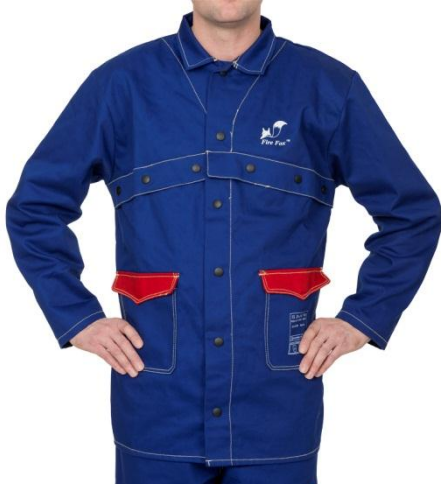
33-2300 welding jacket