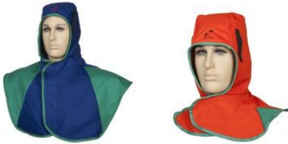
Welding helmet hoods 23-6680, 23-6690