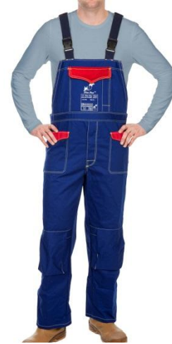
33-2700 welding bib and brace