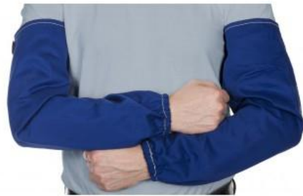
33-2320 welding sleeves