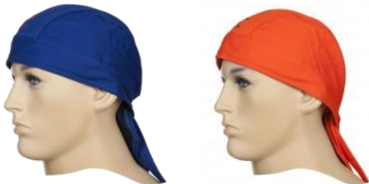
Welding doo-rags 23-3612, 23-3613