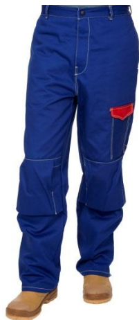
33-2600 welding pants