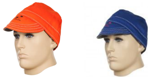
Welding caps 23-*514, 23-*515